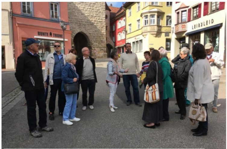
Stadtführung in Rottweil durch unsere sehr kompetente Führerin

In Rottweil wurden wir von ein paar zaghaften Sonnenstrahlen und dem Ehepaar Sobko begrüßt und nach einer kurzen